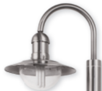
■ FINDO EL-1425