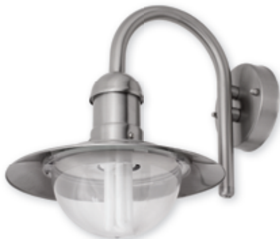
■ FINDO EL-210L-UP