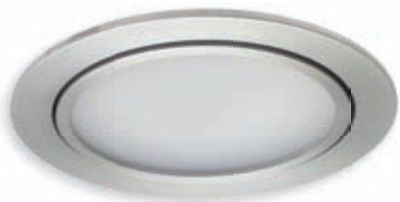
RENDA POWER LED3